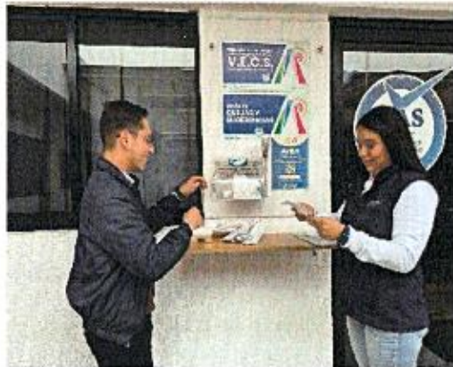
Apertura de buzón del mes de enero de 2026