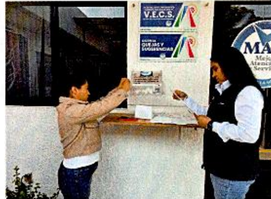
Apertura de buzón del mes de marzo de 2026