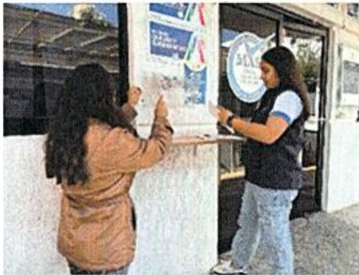
Apertura de buzón del mes de febrero de 2026