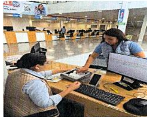
Apertura de buzón del mes de febrero de 2026

En el mes de marzo se realizaron 12 aperturas de buzón del Programa MAS (Mejor Atención y Servicio) con los siguientes resultados: