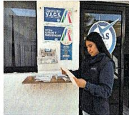
Apertura de buzón del mes de enero de 2026

En el mes de febrero se realizaron 7 aperturas de buzón del Programa MAS (Mejor Atención y Servicio) con los siguientes resultados: