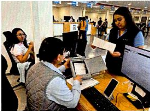
Apertura de buzón del mes de marzo de 2026