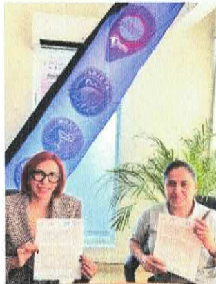
Inspección Visual Muñiz