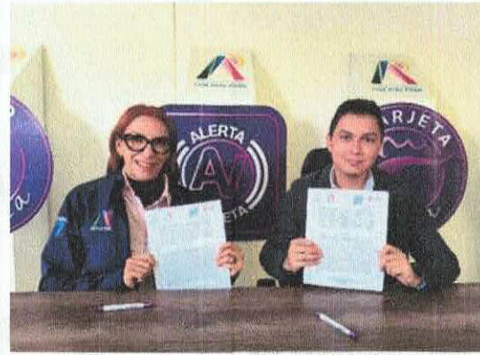
Pass Automotive México

Handwritten signatures and initials in blue ink on the right side of the page.