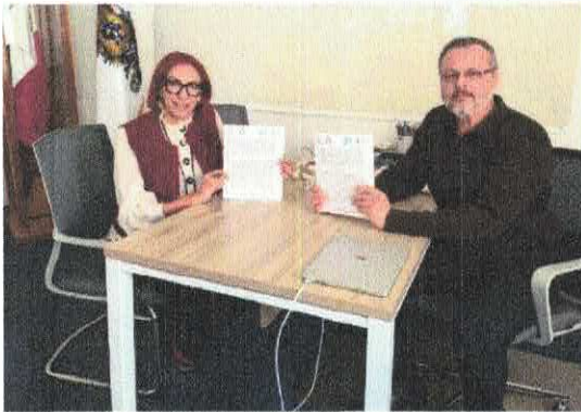
HighPoint International School Irapuato

El Instituto establece dicha base de vinculación, coordinación y colaboración, con la finalidad de llevar a cabo acciones afirmativas, estrategias y coadyuvar con la política pública de prevención, atención y eliminación de la violencia contra las mujeres en el municipio de Irapuato.