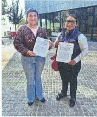
Würth Electronic México