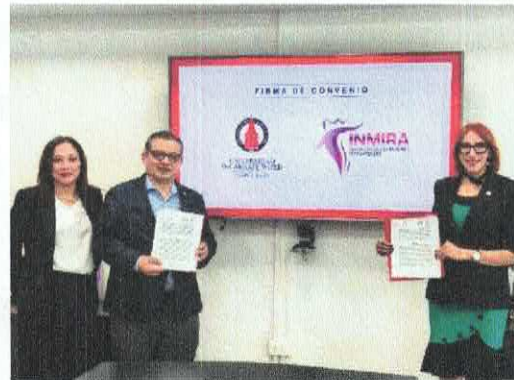
Universidad Incarnate Word