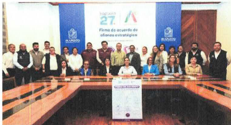
Firma de acuerdo de alianza estratégica

[Handwritten signatures and initials in blue ink on the right side of the page]