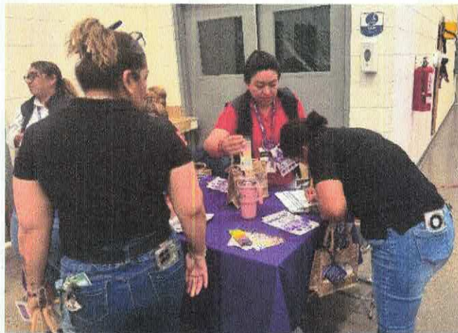
Participación del INMIRA en la feria de servicios en conmemoración del 8M, atendiendo a 13 personas.