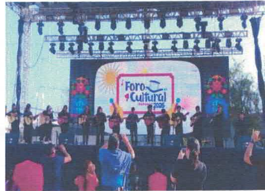
Ensamble Musical Champagnat Foro Cultural de la Feria Acervo fotográfico del IMCAR. Marzo, 2026