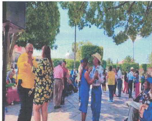
Jueves de Danzón Barrio de San Vicente Enero, 2026