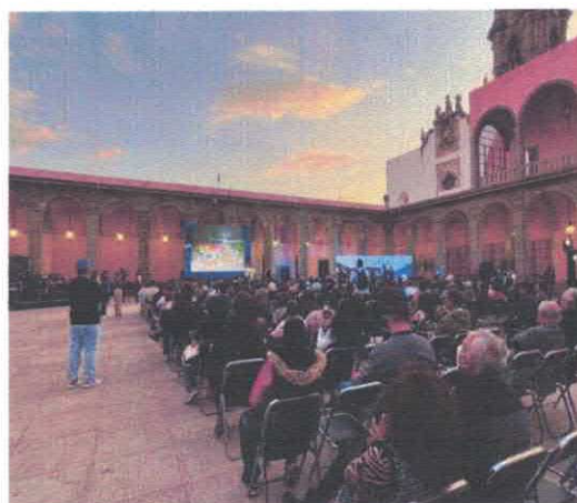
Presentación de la Restauración de la Presidencia Municipal (Filarmónica Mahler) Presidencia Municipal Febrero, 2026