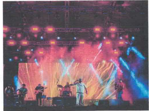
Grupo Eben Foro Cultural de la Feria Acervo fotográfico del IMCAR. Marzo, 2026

Handwritten signatures and initials in blue ink, including a large signature at the bottom left and several smaller ones on the right side.