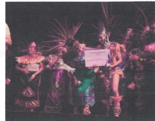
Final Categoría Jóvenes y Adultos 2° Convocatoria Danzarte Teatro de la Ciudad Marzo, 2026