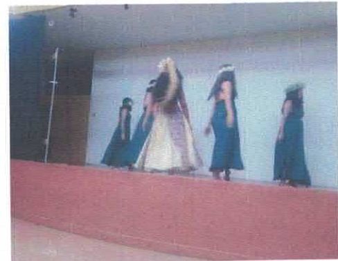
Propuesta Escénica Mana Wahine Templo de San Cayetano Marzo, 2026