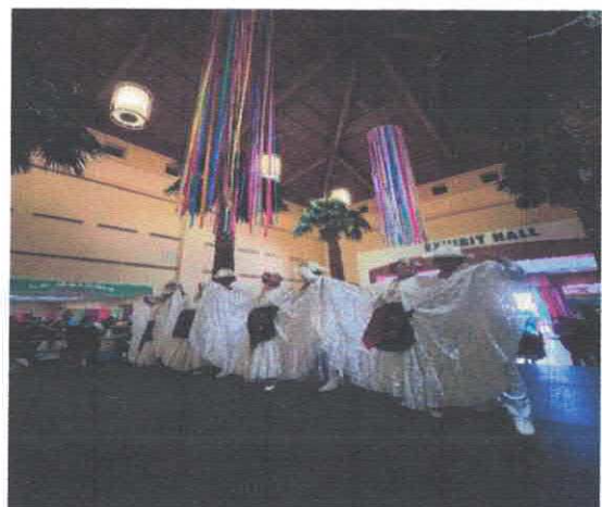
Presentación artística SISTER CITIES STAGE Centro de convenciones de McAllen Marzo, 2026