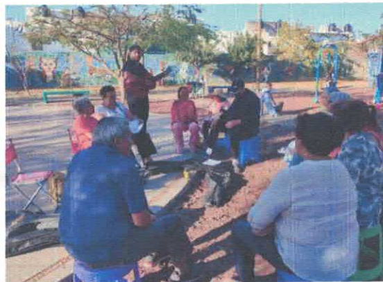
Guitarra y Canto con alumnos del grupo "Recuerdos del Ayer" Parque del Fraccionamiento Nogalia Marzo, 2026