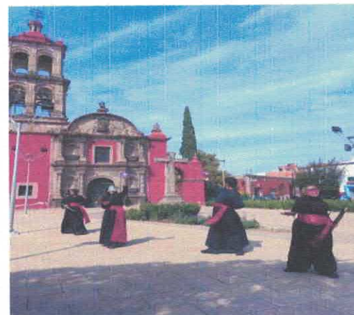
Narradores Ambulantes Centro Histórico Febrero, 2026