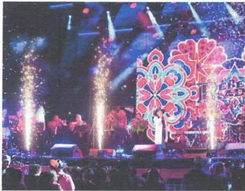
Orquesta Perez Prado y Roco Pachukote Andador Sor Juana Febrero, 2026