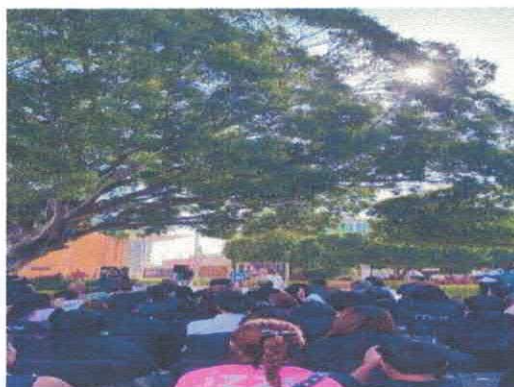
Exposición "Alma de Barrio" Plaza del Artista Febrero, 2026