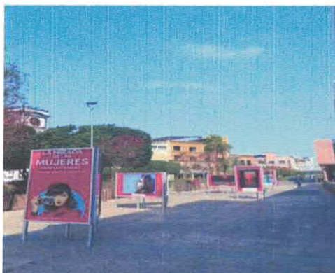
Exposición "La Mirada de las Mujeres Irapuatenses" Andador Juárez Marzo, 2026