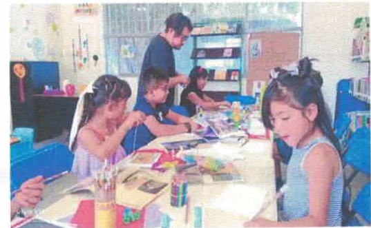
Taller literario: un viaje hacia la imaginación Biblioteca Pública Constitución de Apatzingán Marzo, 2026