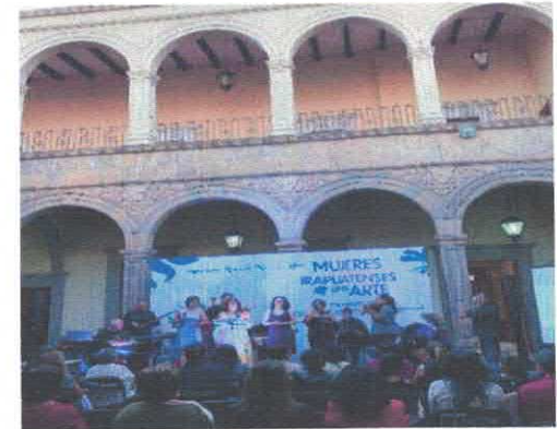
Concierto Ramito de violetas, el alma de las mujeres poetas y compositoras Museo Salvador Almaraz Acervo fotográfico del IMCAR. Marzo, 2026