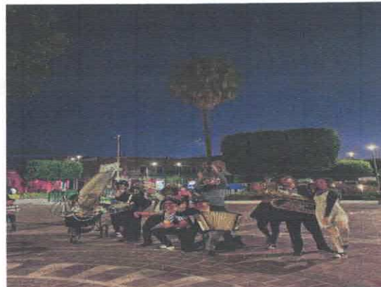
La Marcha Submarina pneumus Teatro Barrio de Santiaguito Acervo fotográfico del IMCAR. Marzo, 2026