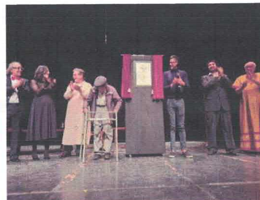
Festival de la Ciudad Presentación 3 de Chèjov Teatro de la Ciudad Febrero, 2026

Handwritten signatures and scribbles in blue ink.