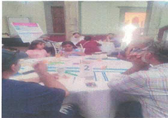
Foro de diálogo para la construcción de la vida cultural en los barrios tradicionales Museo Salvador Almaraz Marzo, 2026