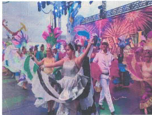
Grupo Magisterial De Danza Folkórica "Ziua Temachtiani" Foro Cultural de la Feria Marzo, 2026