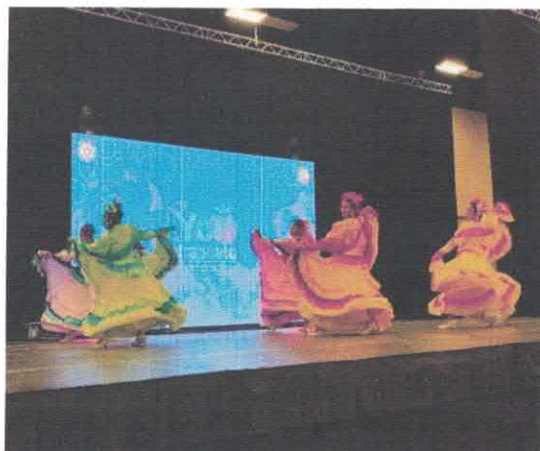
Presentacion artistica COMMUNITY STAGE Centro de convenciones de McAllen Marzo, 2026