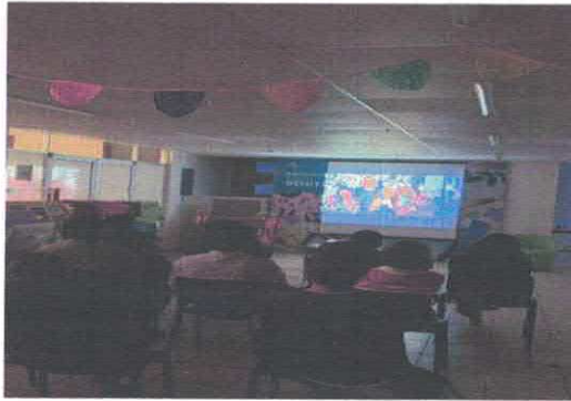
Ciclo de cine: Primavera documental. "Juntas somos más fuertes" Biblioteca Pública Antonio González Marzo, 2026