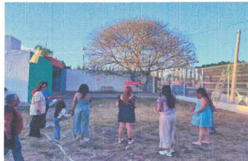
Primer encuentro de poesía experimental. Biblioteca Pública Sor Juana Inés de la Cruz Acervo fotográfico del IMCAR. Marzo, 2026