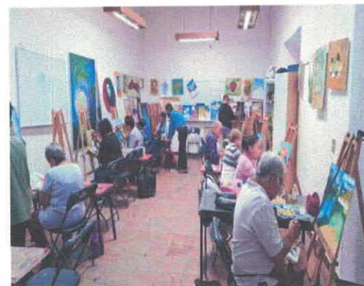
Pintura Adultos Casa de Cultura Centro Marzo, 2026