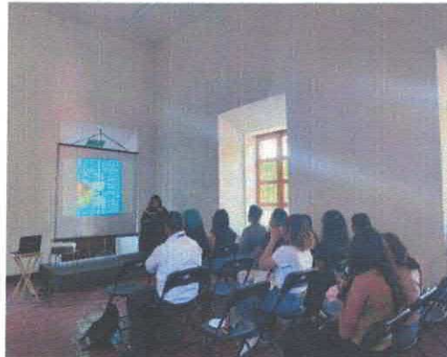
Convergencias, Artes visuales, presentaciones literarias Casa de la Cultura Marzo, 2026