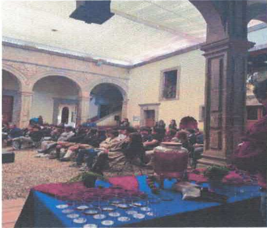
Conversatorio Vivir del Arte de la Cartonería. Por Britani Walker, Citlali Villanueva y Josué Eleazar Castro Museo Salvador Almaraz Marzo, 2026