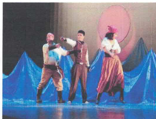
"Océano" enSEÑA Teatro Teatro de la Ciudad Marzo, 2026