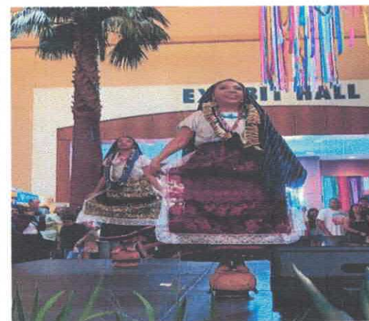
Presentacion artistica OVAL PARK Centro de convenciones de McAllen Marzo, 2026