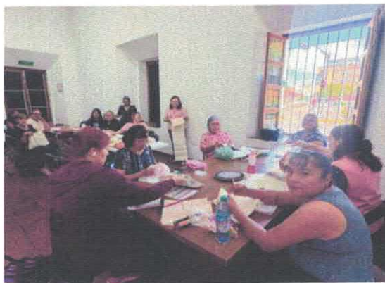
Bordado Casa de Cultura Centro Acervo fotográfico del IMCAR. Marzo, 2026