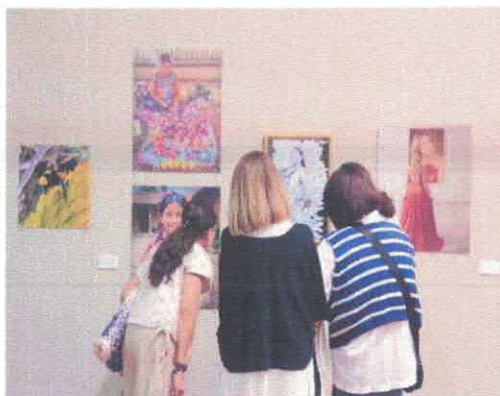
Exposición "MIA. Mujeres Irapuatenses en el Arte. Nosotras" Museo Salvador Almaraz Marzo,