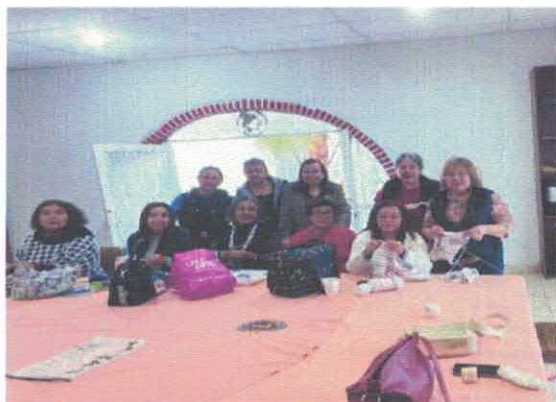
Circulo de Tejido Club de Leones Acervo fotográfico del IMCAR. Marzo, 2026