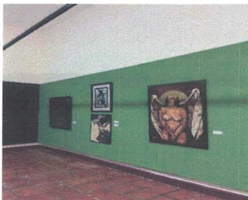
Exposición "Muestra Plástica Irapuatense" Museo Salvador Almaraz Febrero, 2026