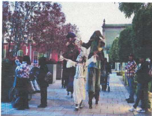
Presentación: Zaiko Circo Luna Morena Andador Juárez Enero, 2026