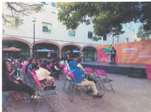
Festival de la Ciudad "Somos Eraitzicutzio" Andador 5 de Mayo Febrero, 2026