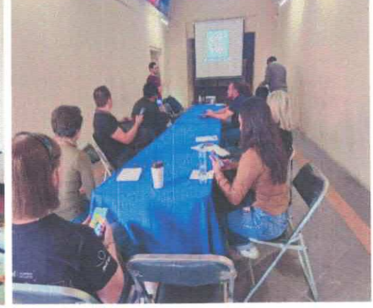
Taller "Fotografía de Barrio" Daniel Arroniz Museo Salvador Almaraz Acervo fotográfico del IMCAR. Febrero, 2026