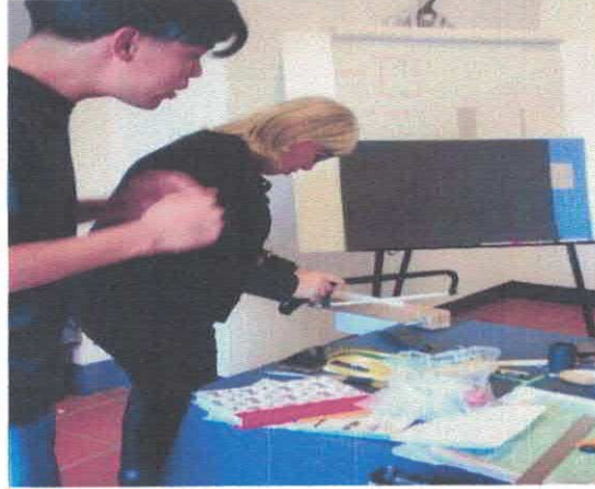
Taller "El libro de tu ciudad" Colectivo gráfico El Solar Museo Salvador Almaraz Febrero, 2026