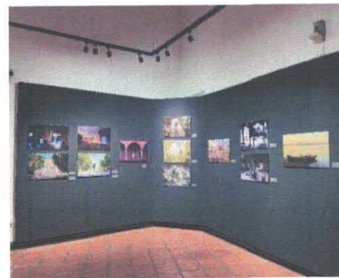
Exposición "La Mirada de lo Nuestro" Museo Salvador Almaraz Acervo fotográfico del IMCAR. Febrero, 2026