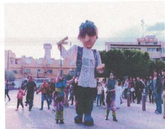
El Niño que llegó a las nubes. La Cienega Teatro Ágora del Hospitalito Acervo fotográfico del IMCAR. Enero,

Handwritten signatures and scribbles in blue ink.