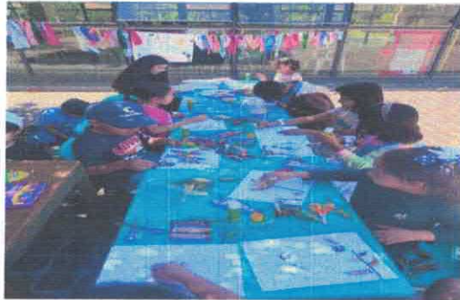
Picnic literario primaveral. Biblioteca Pública Antonio González Acervo fotográfico del IMCAR. Marzo, 2026