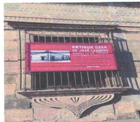
Exposición: "Muros de La Piedra Lisa" Exterior Museo Salvador Almaraz Febrero, 2026