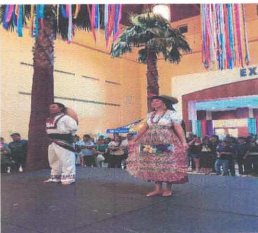
Presentación artística OVAL PARK Centro de convenciones de McAllen Marzo, 2026

Handwritten blue ink scribbles and signatures on the right side of the page.