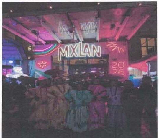
Presentación artística SISTER CITIES STAGE Centro de convenciones de McAllen Acervo fotográfico del IMCAR. Marzo, 2026