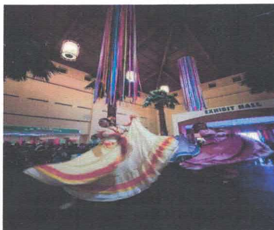
Presentacion artistica COMMUNITY STAGE Centro de convenciones de McAllen Marzo, 2026