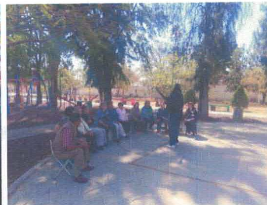
Coro de adultos mayores "Añoranzas" Parque las Brisas Marzo, 2026

Handwritten signatures and a page number '25' in the bottom right corner.