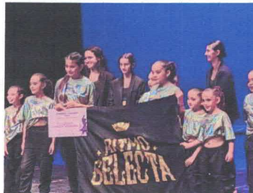
Final Categoría Infantil 2° Convocatoria Danzarte Teatro de la Ciudad Marzo, 2026