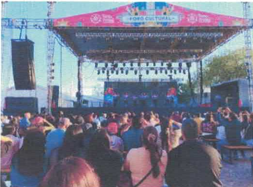
Vértigo Studio Foro Cultural de la Feria Marzo, 2026