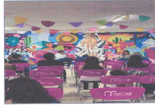
Presentación editorial: "Lacan, lector de oriente: Escrituras al vacío" Biblioteca Pública Benito Juárez Marzo, 2026