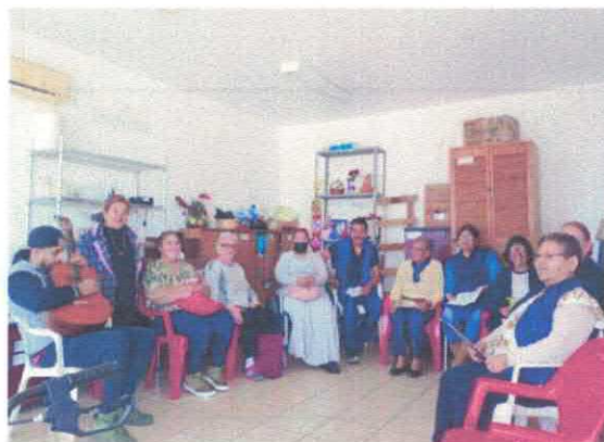
Coro Gerontológico 1ra., de mayo Marzo, 2026