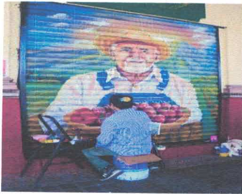
Intervenciones Urbanas Artísticas Plásticas. Zona Centro Febrero, 2026