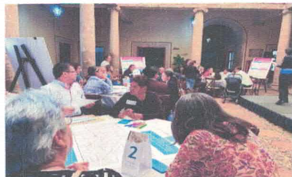
Foro A los Barrios no se invita, se llega Casa de la Cultura Octubre, 2025

A partir de las encuestas llevamos a cabo dos foros de diálogo que nos permitieron acercarnos a los habitantes de las zonas para conocer sus historias, inquietudes, anhelos y, especialmente, la memoria que resguardan y en la que se encuentra una significativa cantidad de nuestra identidad local. En la realización de los foros participaron organizaciones civiles como Expertis, Profesionistas y dependencias municipales como la Coordinación del Centro Histórico y la Dirección de Desarrollo Social y Humano.