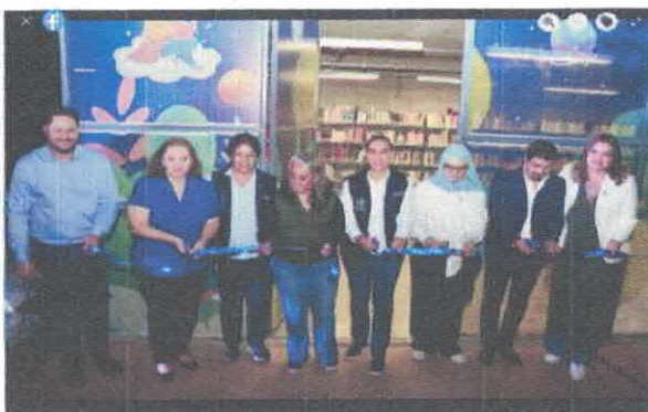
Festival Sentipensares Inauguración de Biblioteca Pública Antonio González Parque Irekua Noviembre, 2025