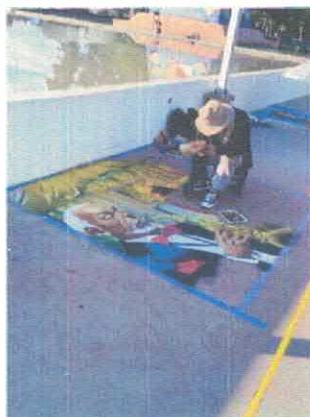
Convocatoria Madonnari Parque Irekua Noviembre, 2025