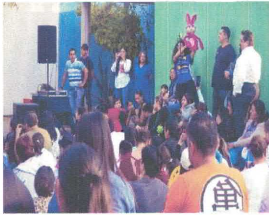
Festival Internacional de Teatro de Títeres Bocón Jack Distortions Bullicio Puppets Biblioteca Pública Sor Juana Inés de la Cruz Acervo fotográfico del IMCAR. Noviembre, 2025