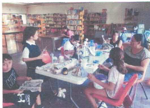
Taller escultura catrina Biblioteca Pública Juanita Hidalgo Noviembre, 2025