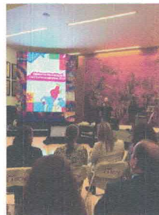
Presentación del Sistema de Convocatorias 2026 Teatro de la Ciudad Acervo fotográfico del IMCAR. Noviembre, 2025