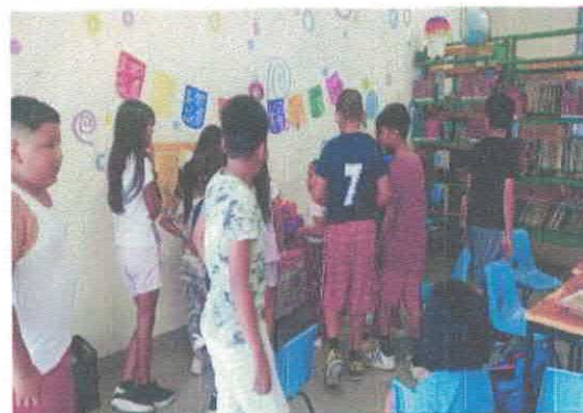
Taller "Altar de muertos a Rosario Castellanos" Biblioteca Pública Constitución de Apatzingán Octubre, 2025