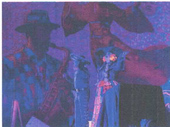
Convocatoria Concurso de Catrinas y Catrines Rinconada de los murales Octubre, 2025