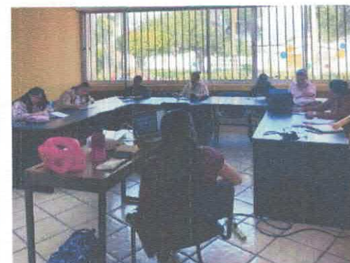
Escribir la hierba. Taller de poesía Biblioteca Pública Benito Juárez Noviembre, 2025