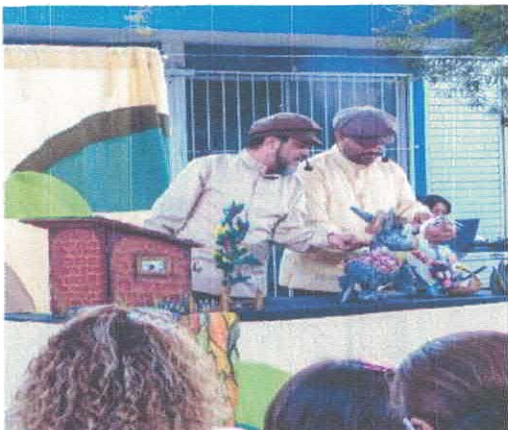
Festival Internacional de Teatro de Títeres Bocón Este chivo es puro cuento Merequetengue Centro Gerontológico 1ro. de Mayo Noviembre, 2025