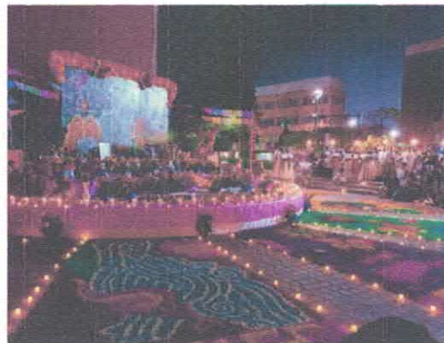
9° Festival Reviviendo Tradiciones Altar Monumental Colectivo de Artistas Irapuatenses Ágora del Hospitalito Octubre, 2025