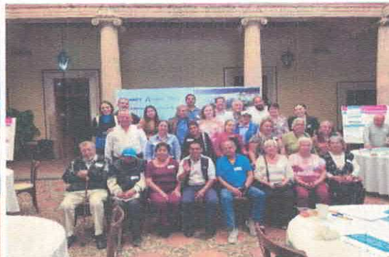
Foro A los Barrios no se invita, se llega Casa de la Cultura Octubre, 2025