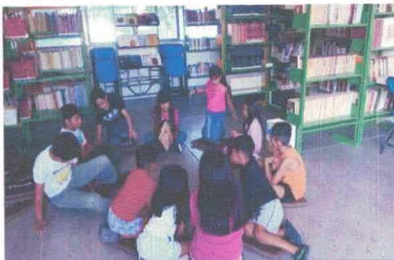
Círculo de lectura "Bigu" Biblioteca Pública Constitución de Apatzingán Acervo fotográfico del IMCAR. Octubre, 2025