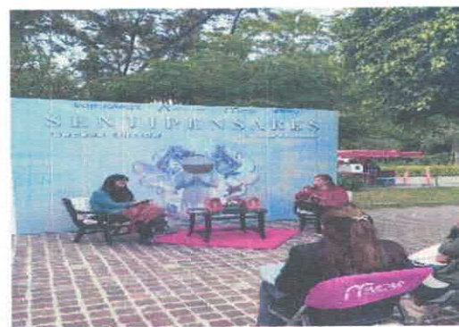
Presentación editorial. Cartografía de una medicación Biblioteca Pública Antonio González Noviembre, 2025