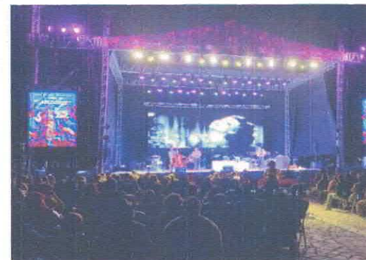
24º Festival de Jazz Jazz y Cine Familiar Pneumus Parque Irekua Acervo fotográfico del IMCAR. Noviembre, 2025