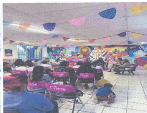
Escrituras corpóreas Mesa de diálogo Biblioteca Pública Benito Juárez Acervo fotográfico del IMCAR. Noviembre, 2025