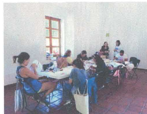
Taller de Bordado Casa de Cultura Centro Acervo fotográfico del IMCAR. Octubre, 2025