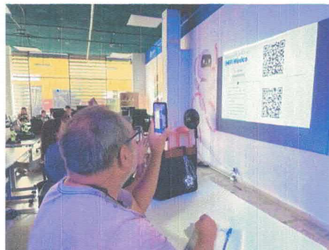
Vivir del Arte Casa del Emprendimiento Diciembre, 2025