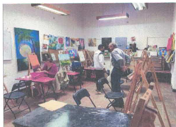
Taller de Pintura para adultos Casa de Cultura Centro Acervo fotográfico del IMCAR. Noviembre, 2025