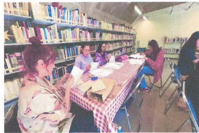
Festival Sentipensares Libraco. Taller de Encuadernación Biblioteca Pública Antonio González Noviembre, 2025