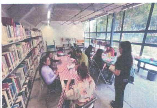
Libraco. Taller de encuadernación Biblioteca Pública Antonio González Noviembre, 2025