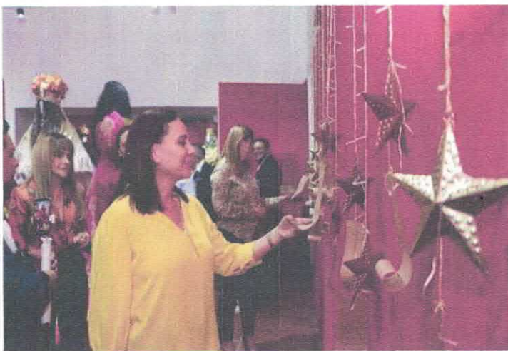
Queridos Reyes Magos. 50 años de magia Museo Salvador Almaraz Acervo fotográfico del IMCAR. Diciembre, 2025