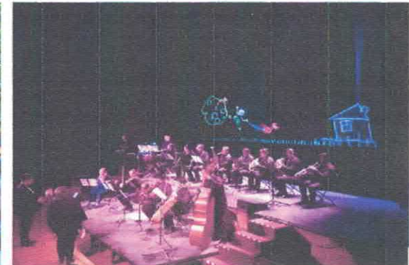
53° Festival Internacional Cervantino Pedro y el lobo Compañía Títeres ETCétera Teatro de la Ciudad Acervo fotográfico del IMCAR. Octubre, 2025