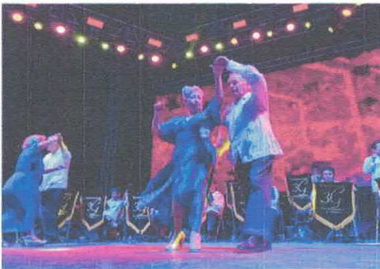
53° Festival Internacional Cervantino Agustín Lara: Entre sones y danzones Danzonera Tres Generaciones Teatro de la Ciudad Acervo fotográfico del IMCAR. Octubre, 2025