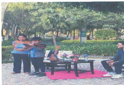
Presentación editorial "Gallo, el planeta estalla" Biblioteca Pública Antonio González Noviembre, 2025