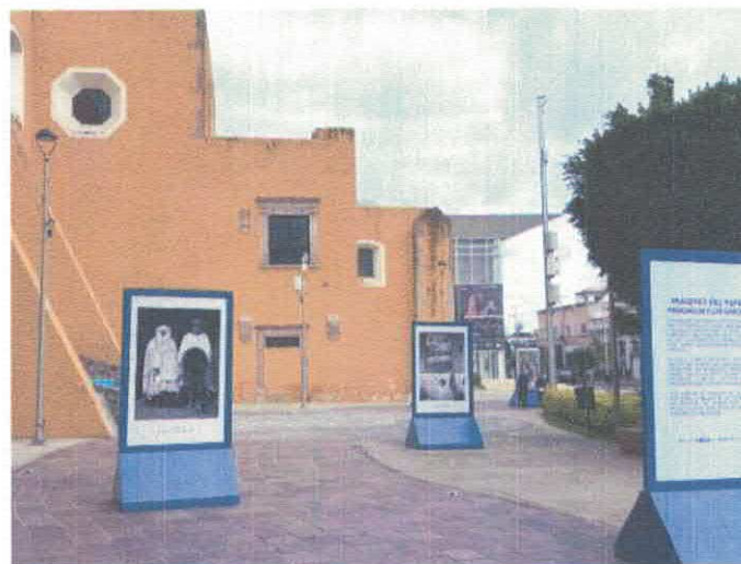
Imágenes del mundo Plaza del Artista Acervo fotográfico del IMCAR. Octubre, 2025