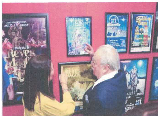
Queridos Reyes Magos. 50 años de magia Museo Salvador Almaraz Acervo fotográfico del IMCAR. Diciembre, 2025