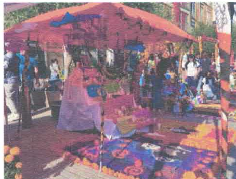
Convocatoria Elaboración Altar de Muertos Andador Sor Juana Octubre, 2025