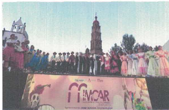
4º Encuentro de Danza Folklorica Ballet Folklorico X'Quenda y Ballet Folklorico Yolotmaseuani Plaza Miguel Hidalgo Acervo fotográfico del IMCAR. Octubre, 2025