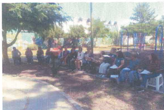
Coro de adultos mayores "Añoranzas" Parque Las Brisas Octubre, 2025

En el programa Cultura Mayor continuamos con procesos formativos a través de talleres y cursos que han permitido la integración de las personas mayores de 65 años en actividades de desarrollo cultural de una manera proactiva, y en diversas ocasiones, desde un rol de principal en los eventos realizados. Durante el trimestre llevamos a cabo cinco talleres, en los que participan 69 personas. Entre los talleres se destacan Pintura para adultos , Circulo de Tejido , Coro de adultos mayores , Bordado , Barro y Cerámica para adultos .