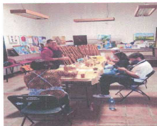
Taller de Barro y Cerámica para adultos Casa de Cultura Centro Acervo fotográfico del IMCAR. Noviembre, 2025