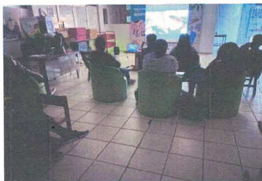
Bibliocinema Biblioteca Pública Benito Juárez Noviembre, 2025