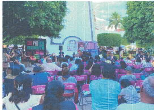
53° Festival Internacional Cervantino Ni retablo, ni maravilla Plaza principal Octubre, 2025