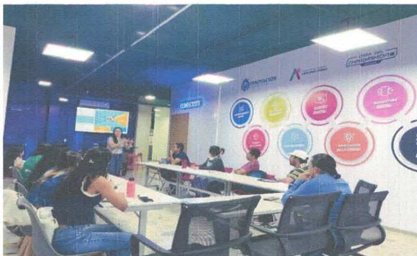
Vivir del Arte Casa del Emprendimiento Noviembre, 2025

Durante el cuarto trimestre avanzamos en la conformación del programa Vivir del Arte en coordinación con la Dirección de Economía a través de la Casa del Emprendimiento, con quienes llevamos a cabo un programa de formación elaborado a partir de un primer diagnóstico de acercamiento, que dio inicio con los talleres de Ecosistema Creativo , conformado por 6 procesos formativos en los que se impartieron conocimientos generales sobre las estrategias para la planeación de un esquema financiero aplicado al desarrollo creativo, y en el que participaron un total de 58 personas.