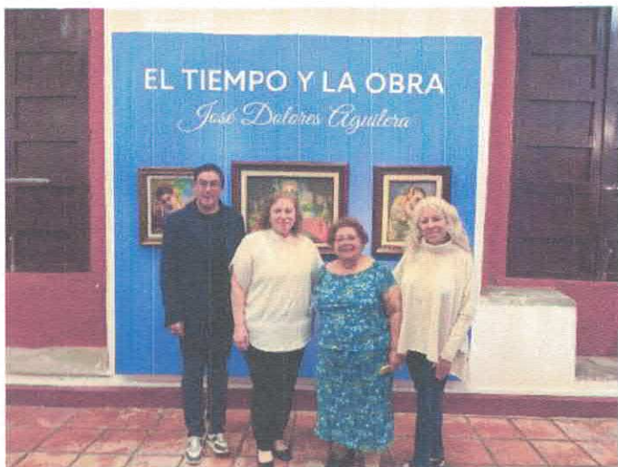
El tiempo y la obra Museo Salvador Almaraz Octubre, 2025