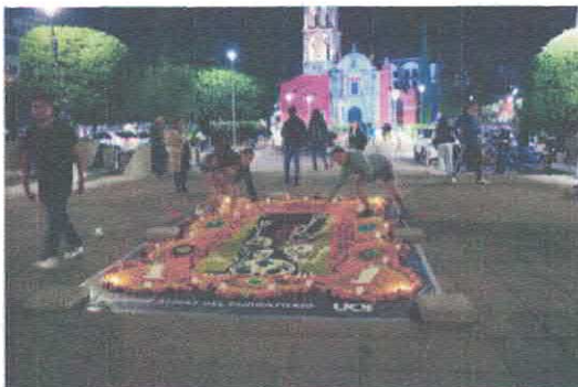
Convocatoria Elaboración de Tapetes de día de Muertos Plaza de los Fundadores Octubre, 2025

participan en ellas. A través de la organización de 6 foros, dimos paso a un significativo ejercicio de participación ciudadana en el ejercicio de los derechos culturales.