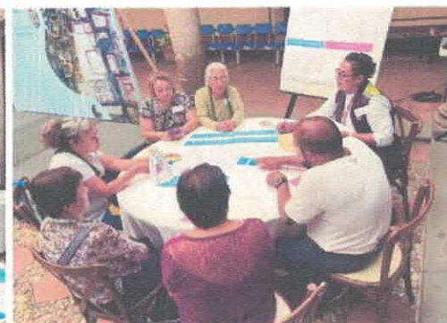
Foro A los Barrios no se invita, se llega Casa de la Cultura Octubre, 2025