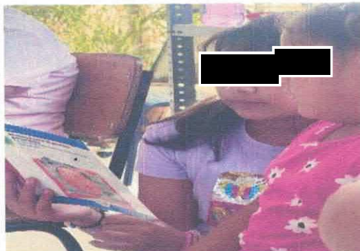
Círculo de lectura "Un confuso sueño de palabras" Biblioteca Pública Benito Juárez Acervo fotográfico del IMCAR. Octubre, 2025