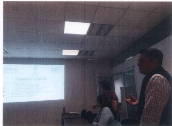
Fotografía 6. Capacitación “Blindaje Electoral para Servidores Públicos”

En acompañamiento de la Coordinación de Asuntos jurídicos solicitamos el convenio correspondiente a la Dirección General de Movilidad y Transporte para regularizar el espacio que es usado como oficinas y el espacio que usan como estacionamiento para los camiones obteniendo como resultado la solicitud formal con el oficio DGMT/DT/RMT/117/2024 con el cual inicia el trámite que regulariza su situación como comodatarios de DIF.