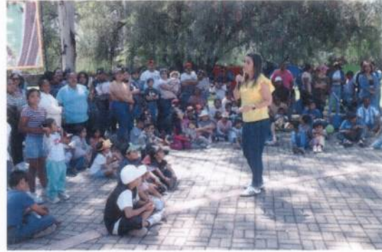
Fotografía 4. Evento de la familia.

Comprometidos con hacer de nuestra ciudad con perspectiva familiar, celebramos el día de la familia, su objetivo es hacernos un recordatorio de que en el seno familiar encontramos amor, unión valores que fortalecen nuestra sociedad, nos reunimos en el Zoológico de la ciudad, en donde compartimos juegos, dinámicas, inflables, stands informativos, payasos, snacks, teniendo un total de 7 mil participantes, todo esto fue posible gracias al trabajo transversal de las áreas de Comunicación Social, Planeación y Desarrollo Institucional, Fortalecimiento Familiar, Atención a Niñas, Niños y Adolescentes, Capital Humano, Escuela de Enfermería e Inclusión Social; así como INMIRA, JAPAMI, Secretaría de Seguridad Pública, COMUDAJ, Dirección General de Salud, IMJUVI.