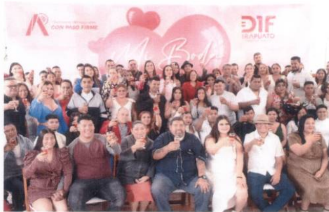
Fotografía 2. Bodas Colectivas DIF

Acompañamos a 50 parejas que contrajeron matrimonio en nuestro Centro Histórico, gracias a nuestras Bodas Colectivas, celebrando de la mejor manera el día del amor fue gracias a Guanajuato Gobierno del Estado que pudieron declarar su amor ante el Registro Civil las y los irapuatenses, quien con atención y emoción escuchaban las palabras de la juez quien daba fe de su unión. Haciendo de este evento “Mi Boda” un momento inolvidable para nuestros ciudadanos.