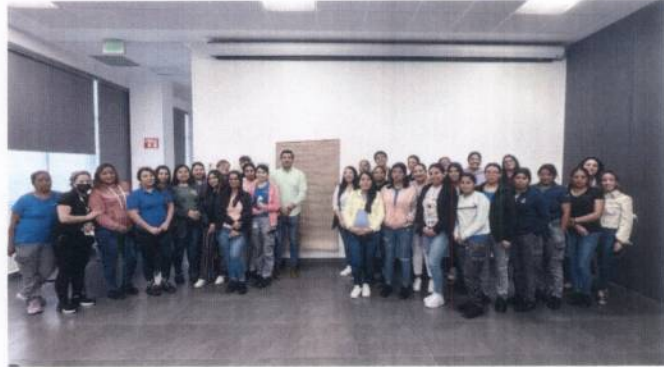
Fotografía 5. Plática a colaboradoras de las empresas.

Impartimos 5 sesiones del tema "Autoestima en la Mujer" a colaboradoras de empresas como: Webasto, Mr. Lucky, GEMOMEX, con la finalidad de conmemorar el Día Internacional de la Mujer y resaltar la importancia de la mujer en la sociedad actual. Además, brindamos 4 sesiones del tema "Habilidades Socioemocionales" a distintos grupos de la Institución Educativa Colegio Interamericano con el objetivo de fortalecer las herramientas emocionales para vincularse de manera empática con sus compañeros.