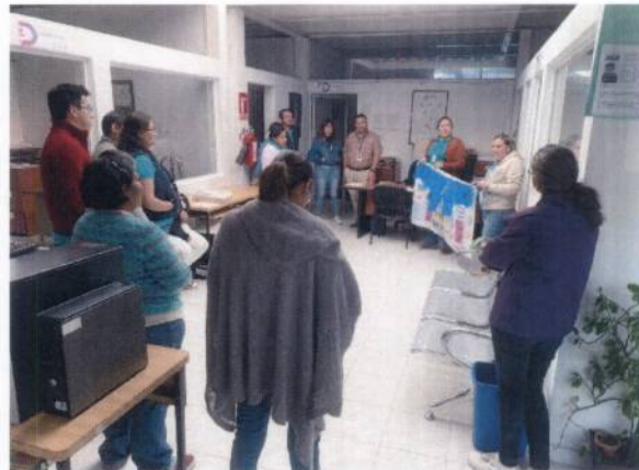
Fotografía 7. Capacitaciones Programa MAS 2024.

Entusiasmados realizamos nuestra cédula de inscripción para participar en la implementación del Programa MAS 2024, fuimos aceptados y estamos más que comprometidos a posicionarnos en los primeros lugares, ya que tenemos el firme objetivo de brindar un excelente servicio a la ciudadanía; es por ello que fijamos planeaciones y compromisos de manera externa e interna, como lo es nuestro calendario anual de aperturas quincenales en compañía de la Contraloría Municipal, llevando hasta el momento 5 aperturas de Buzón, obteniendo buenos resultados de la percepción ciudadana. Hemos puesto en marcha nuestro proyecto de mejora 2024, que consta de gafetes identificados por número y color del módulo a donde van a realizar su trámite o servicio, este permite que la identificación sea más fácil, además de mostrar un sentido de pertenencia en su estancia por las instalaciones.