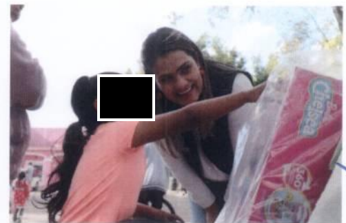
Fotografía 1. Entrega de Juguetes.

Concluimos con éxito nuestras campañas “Abrigando de Corazón” y “Regalando Sonrisas” haciendo entrega de cobijas y juguetes, generando así más de 40 mil sonrisas en 163 comunidades y colonias de nuestro municipio. Teniendo un total de 35 mil 340 juguetes y 5 mil 635 cobijas. A demás de 363 apadrinamientos especiales para nuestras niñas y niños bajo resguardo, logrados con la gestión de la Coordinación de Vinculación y Articulación y nuestros aliados estratégicos que son el sector empresarial y asociaciones.