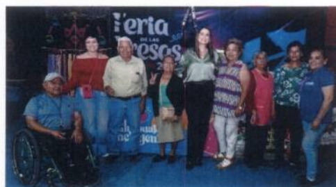
Fotografía 3. Participación Feria de las Fresas Incluyente 2024.

Participamos en la Feria de las Fresas Irapuato, esta edición cuenta con una certificación como espacio incluyente, es decir, que las instalaciones fueron adecuadas para que nuestros usuarios con discapacidad pudieran acudir de manera cómoda y segura. Nuestro personal estuvo presente en un stand, en donde estuvimos dando temas de sensibilización, actividades familiares y primordialmente dando un servicio de calidad a las y los visitantes. Llevamos a nuestras niñas, niños y adolescentes bajo resguardo, a los usuarios del Dr. Sonrisas y usuarios de la Dirección de Atención a Niñas, Niños y Adolescentes de DIF, a la feria de las fresas, donde pasaron una tarde excelente llena de diversión, juegos, circo y más.