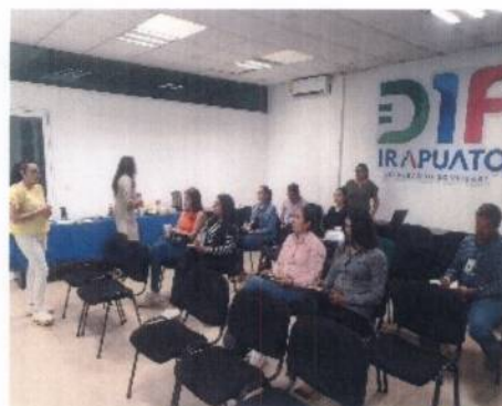
Fotografía 8. Presentación de Lineamientos Distintivo DIF 2024.

Realizamos la presentación de los Lineamientos de Participación para la Obtención del “Distintivo DIF al Compromiso Social del Sector Público y Privado en el Municipio de Irapuato, Guanajuato” a Empresas, Instituciones Educativas y Asociaciones Civiles.