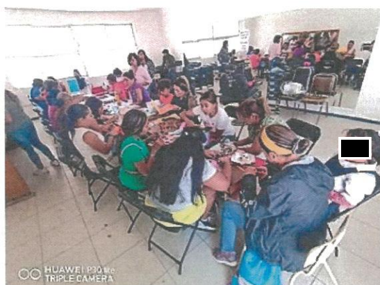
Taller de manualidades