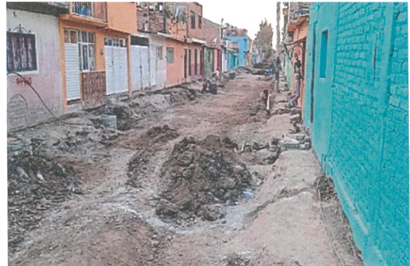
Pavimentación de la calle Héctor Alvarado - Colonia Lucio Cabañas