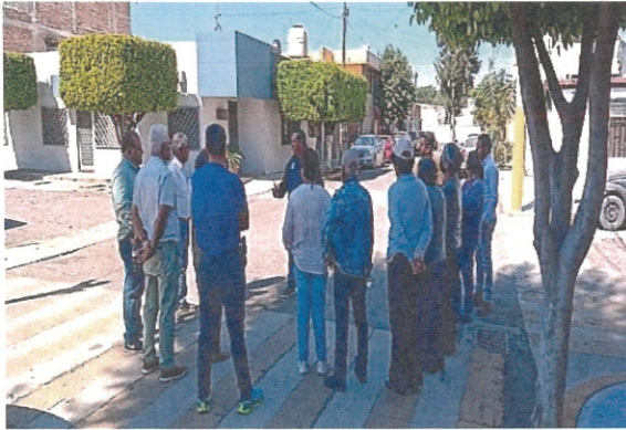
Comité Pro-Obra Calle Turquesa Col. las Arboledas