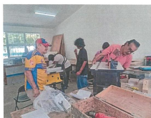
Taller de Carpintería