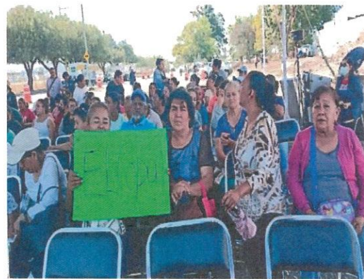
Convocatoria en Loma Bonita, Carrizalito, Ejido Malvas, San Vicente de Malvas, Carrizal Grande, El Copal, El Copalillo para el evento de arranque de obra de la construcción del Puente Vehicular Carretera Federal Entronque Bulevar Siglo XXI.