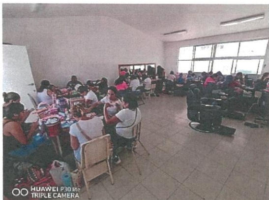
Taller de uñas y pestañas