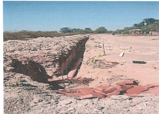
Avance de la planta tratadora de Aguas Residuales y red de drenaje en San Ignacio de Rivera