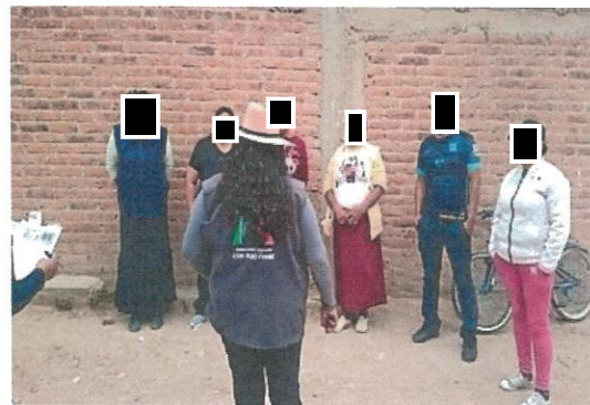
Integración del comité en San Agustín de los Tordos, Guadalupe Villa de Cárdenas