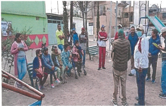
Comité Pro – Obra Calle Santa Coloma Com. San Antonio el Chico