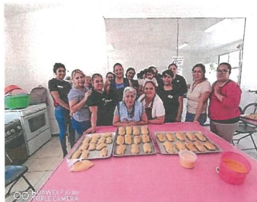
Taller de cocina y repostería