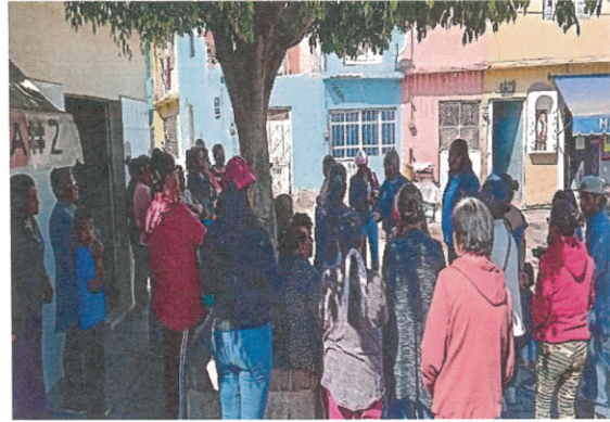
Comité Pro-Obra Calle Villacoapa Col. San Juan de Retana