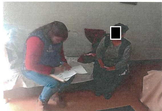
Estudio socioeconómico en Purísima del Jardín.