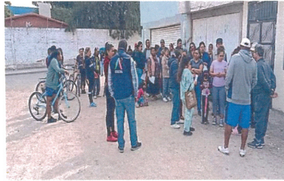
Comité Pro – Obra Calle Nicolás Bravo Col. Constitución de Apatzingán