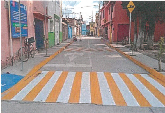
Pavimentación de la Calle 3 de Abril Colonia Che Guevara