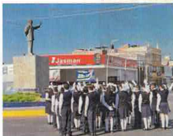
Aniversario del Natalicio Benito Juárez