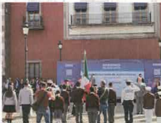
Abanderamiento de escoltas